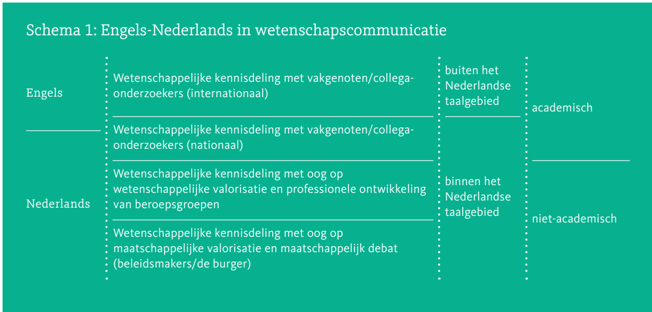
Schema 1: Engels-Nederlands in wetenschapscommunicatie